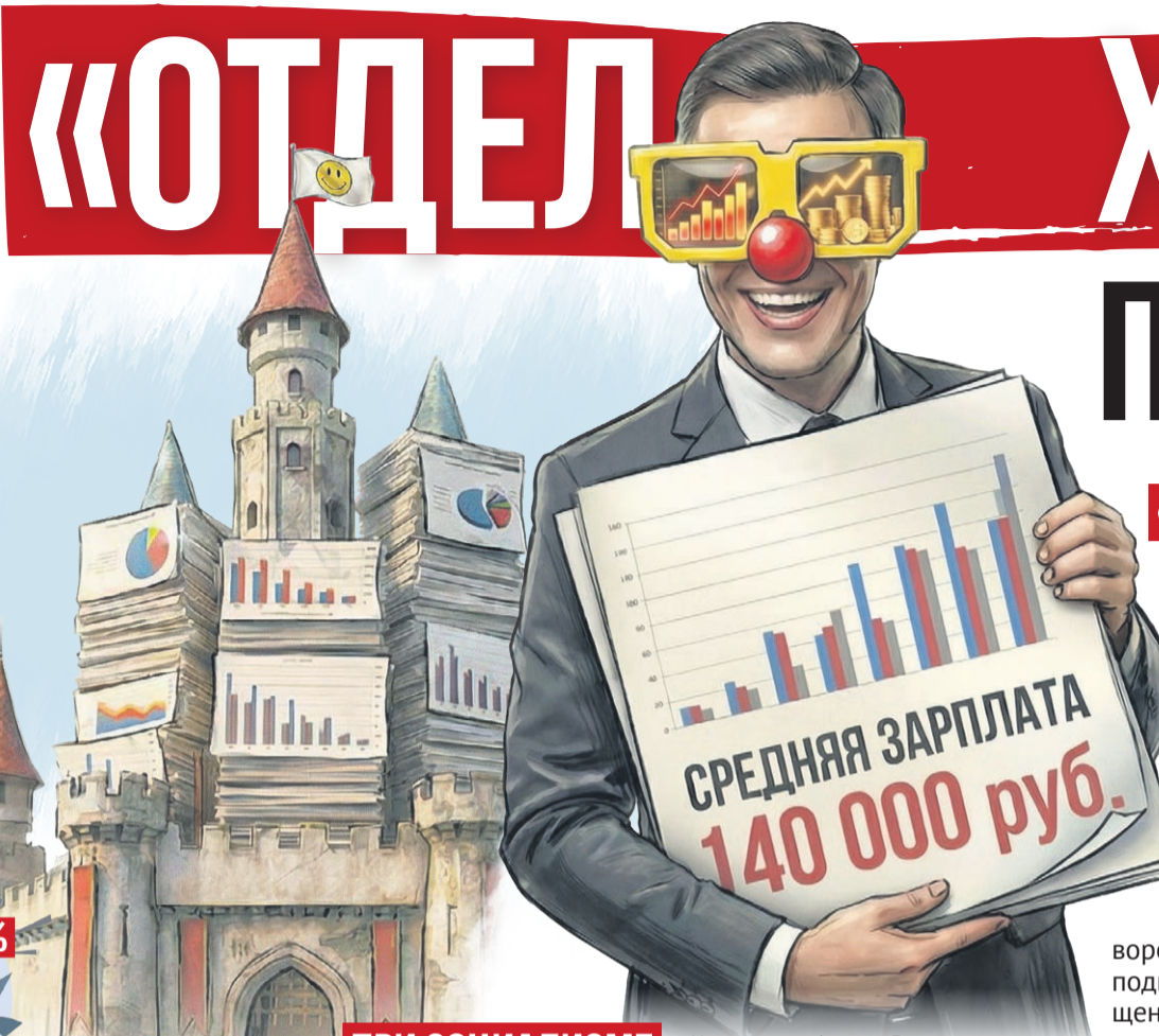
Иллюстрация: Алексей Беленев